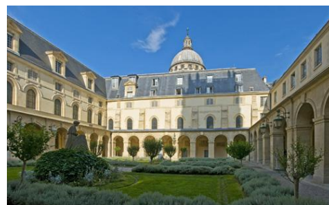
Cloître du Lycée Henri-IV

Le programme, cette année, sera placé sous le thème de « la correspondance », choisi par le Ministère. Signatures, lectures épistolaires, ateliers de dessin et d'écriture... seront proposés au public, dans le cloître du Lycée, pour compléter la découverte des ouvrages. Deux concerts solidaires pour le Japon et le Vietnam, seront organisés au profit de la Croix-Rouge et de l'association SEME, dans la Chapelle du Lycée.